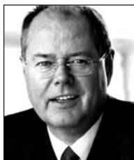
Peer Steinbrück Stellvertretender Vorsitzender Geboren am 10. Januar 1947 in Hamburg, verheiratet, drei Kinder.