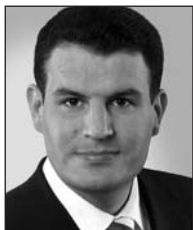
Hubertus Heil Generalsekretär der SPD Geboren am 3. November 1972 in Hildesheim, verheiratet.