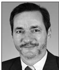
Matthias Platzeck, Parteivorsitzender

Geboren am 29.12.1953 in Potsdam, 3 Kinder,