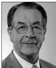
Franz Müntefering, Vizekanzler, Bundesminister für Arbeit und Soziales

Siegmar Gabriel, Bundesminister für Umwelt, Naturschutz und Reaktorsicherheit